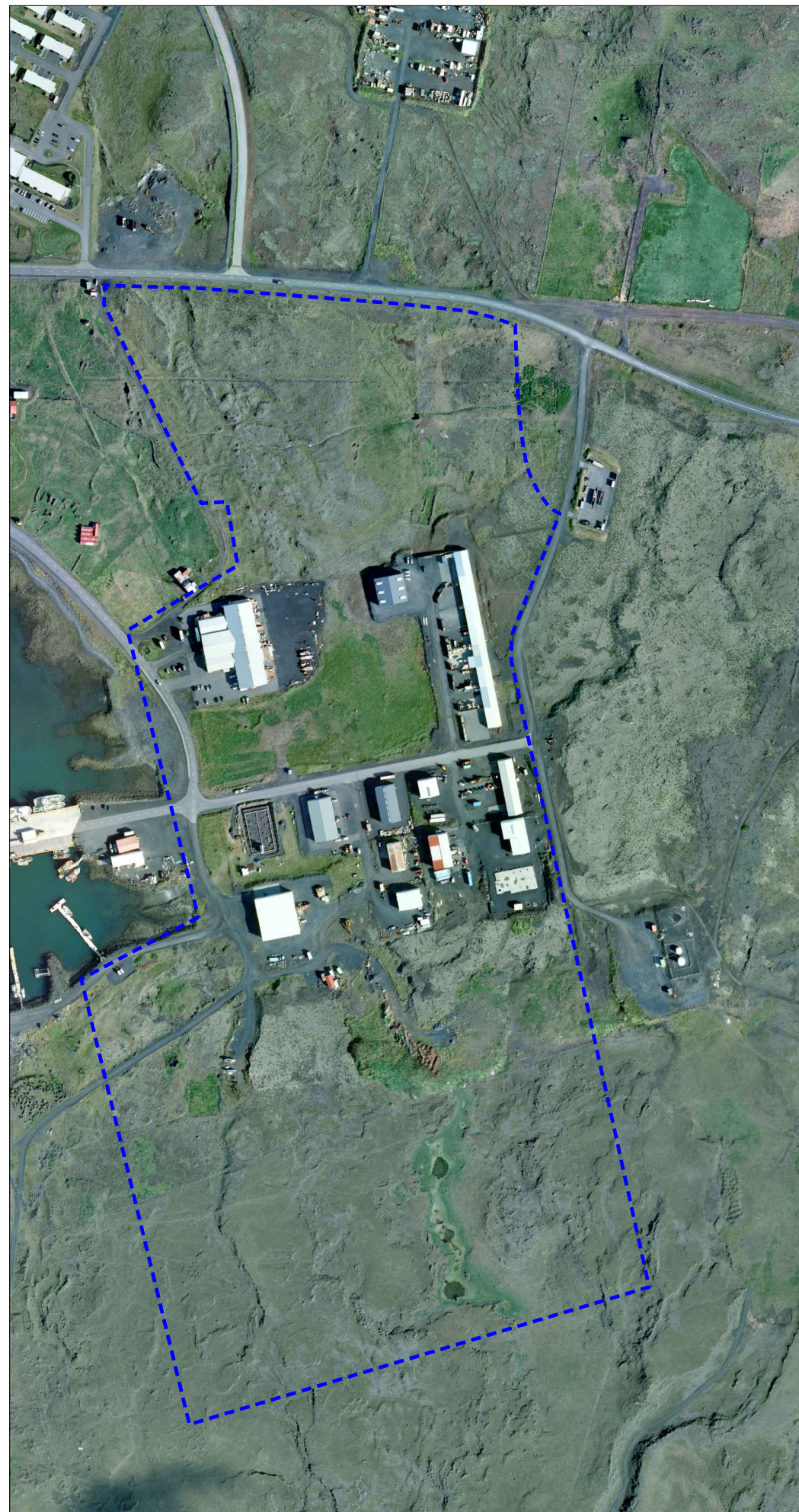
Afmörkun deiliskipulagsreits.

Deiliskipulagstillagan verður auglýst skv. 41. gr. Skipulagslaga nr. 123/2010. Öllum er heimilt aðgera athugasemdir við tillöguna á auglýsingatíma og verður öllum athugasemdum svarað skriflega.