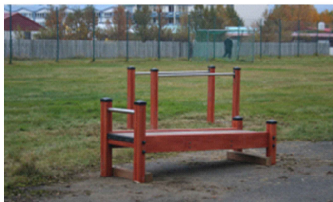
Hugmynd af heilsustígatæki

Heilsustöðvar verða staðsettar á 13 stöðum. Við hverja stöð verða sett upp tæki sem nýta má til heilsuefingar. Á stöðvunum verða einnig skilti með leiðbeiningum fyrir þær æfingar sem gera skal á hverju svæði (sjá www.heilsustig.is ). Upphafsstöð heilsustígs yrði við íþróttamiðstöðina, þar sem væri skilti sem sýnir leiðina ásamt yfirliti yfir heilsustöðvarnar. Benda má á að ráðgert er að nýta Sjómannagarðinn undir frísbíggjufvöll og leiktæki.